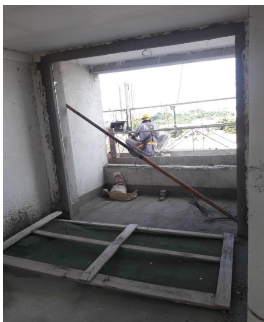
Figura 3 - Varanda impermeabilizada.