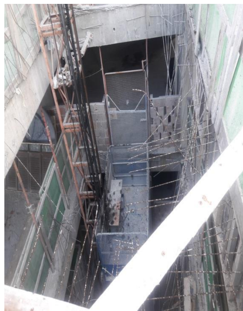
Figura 4 – Armadura.exposta.protegida.