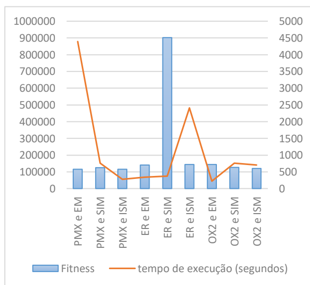
Figura 3 - Resultados obtidos de combinações de operadores para convergência k = 4.