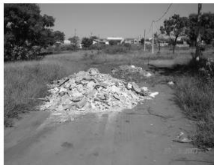
Figura 01: Disposição ilegal de RCC (Fonte: FREITAS, 2009).

O grande problema da geração de resíduos é o seu mau gerenciamento, ou na maioria dos casos a ausência deste, e ainda o elevado desperdício de materiais. Destaca-se que, muitas vezes, estes resíduos são despejados irregularmente ou clandestinamente, o que pode gerar problemas de contaminação no solo e na água subterrânea, além disto, a atividade da construção civil consome recursos naturais, que por fim gerará mais resíduos devido ao desperdício em obras de construção civil. A Figura 01 ilustra exemplo de disposição ilegal de RCC.